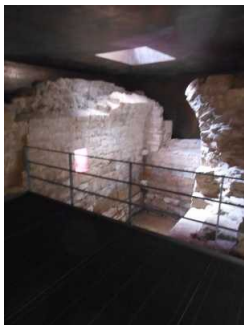
Besichtigungsebene der Mikwe

Auf folgende zu nutzende Wege wird hingewiesen: Weg in der Mikwe