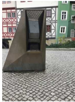
Schaufenster in die Mikwe

Auf folgende zu nutzende Wege wird hingewiesen: Wege außen zum Plateau mit Schaufenster und Treppe zur Mikwe