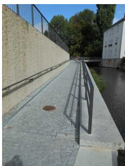
Rampenweg zur Mikwe