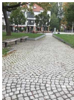
Weg zum Plateau

Über den Weg sind zu erreichen: Eingangsbereich , Plateau mit Schaufenster in die Mikwe