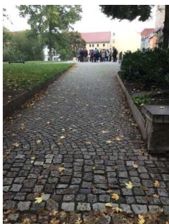
Weg außen zur Mikwe und Plateau