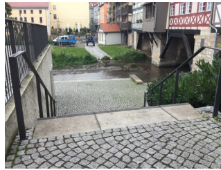
Weg mit Stufen zur Mikwe

Über die Schwelle / Stufe / Treppe sind zu erreichen: Eingangsbereich