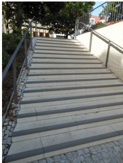
Treppe zur Mikwe