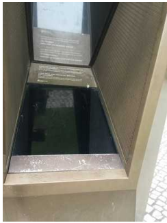
Schaufenster in die Mikwe