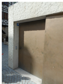
Eingangstür der Mikwe

Zugang zum Eingangsbereich über: Treppe zur Mikwe , Rampe zum Eingang Mikwe