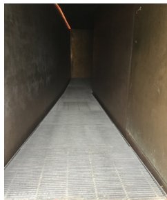
Durchgang zur Mikwe über Gitterrost

Über den Flur / Weg / Durchgang sind zu erreichen: Eingangsbereich , Mikwe